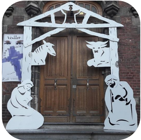
Cette très jolie crèche qui orne l'entrée du château a été réalisée par M. Gallo.

"Elle mit au monde son fils premier né ; elle l'emballota et le coucha dans une mangeoire " Luc II-7